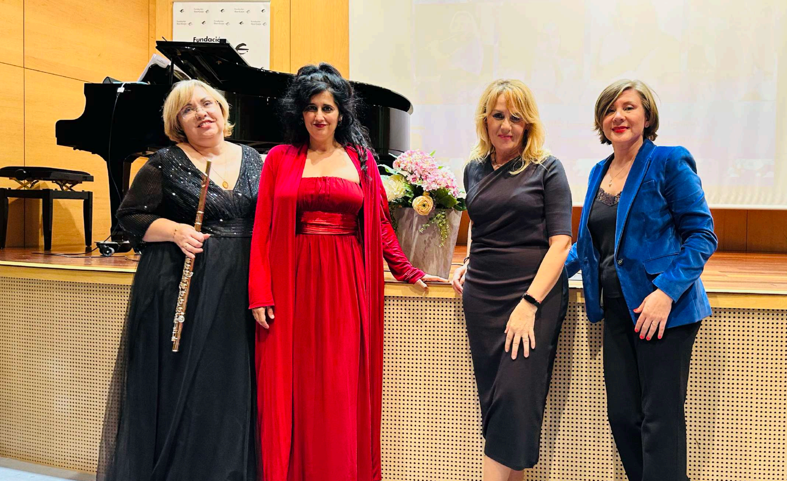
Grupo Musical Kapella